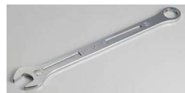
薄口コンビネーションレンチストレート8mm HT8085-08ST-