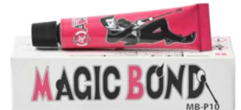
マジックボンドプロ (チューブ入10g) BP5101-4100-