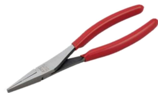
ラジオペンチ(フラットタイプ) HTKT11-0085-